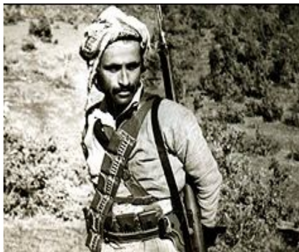
ئەحمەد تۆفوق سكرتیری حیزبى دیمۆكراتى كوردستان

لەمانگى سەرماوەزى سالى 1964، لە گوندى "سونى" ی سەر بە نیوچەى "پشتەدر"، كۆنگرەى دووهمى حیزب گىرا. لەو كۆنگرەيەدا، عەبدوللا ئىسحاقى (ئەحمەد تەوفىق) سەرۆكى حیزب بوو، هاوكات، خۆشەويست و