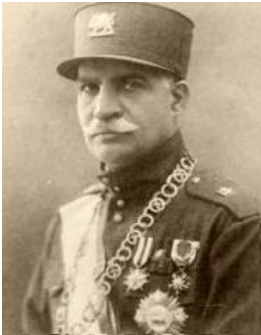
ره‌زاشا دامه‌زیننه‌ری رژیمی په‌هله‌وی

ئەم حەشاماتە زۆرە کاتیک گەرانەوہ بۆ ئێران، ئەو بیروباوەرە نوێیە وافی بۆ خەڵکی شاروگەند و زیدی خۆیان گێراپەوہ. کاتیکیش یەکەمین ریکخراوەی کۆمۆنیستی بەناوی "حیزی کۆمۆنیستی ئێران" لەمانگی جۆزەردانی ساڵی 1299ی هەتاوی بەرامبەر بە مانگی جۆنی 1920ی زانیی، لەپاریژگە گیلان کە هاوسنورە لەگەڵ یەکییتی سوڤیت، لەلایەن کەسایەتی سیاسی و رۆشنبیری ئەو سەردەمە ئێران بەنیوی حەیدەر عەموونوڤلی یەوہ دامەزیندرا، ئەکادیمیەکی ناوداری وەک دۆکتۆر تەقی ئەرانی بوو بە ئەندامی حیزیەکە، ئەم حیزیە توانی لەماوەیەکی کەمدا لەنیو کۆپوکۆمەلە رۆشنبیری و کریکاری لەئێراندا بەخیری گەشەبکات.