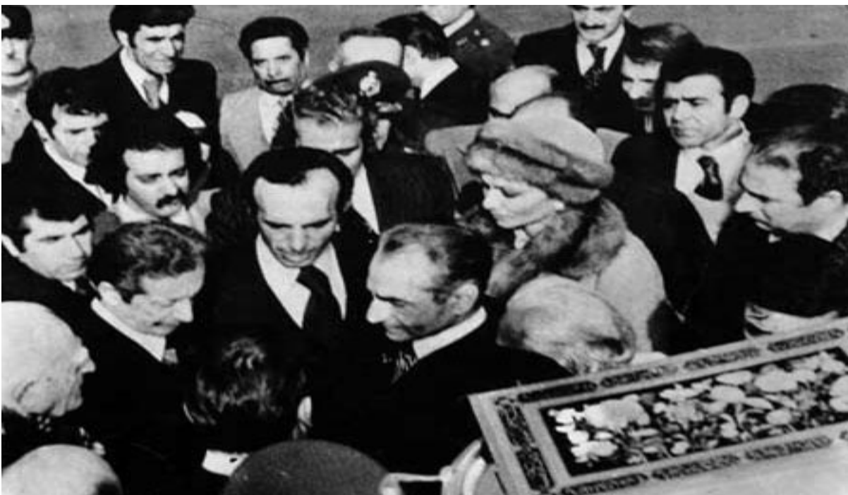
حه مه ره زاشا له کاتی مانئاوایی له هاورێیان و، کاربه ده ستانی رژیمه که ی، بۆ هه میشه ئێران به جیده هیئت

مانگی رێبه ندان، خۆپیشاندان له سه ر شه قام و جاده کانه وه، گوێزایه وه بۆ ته قه و لیکدانی چه کداری و هێرشبردن بۆ سه ربازگه و بنکه کانی پۆلیس و ژاندارم و مالی شه ندامانی ساواک و دایره کانی ساواک و،