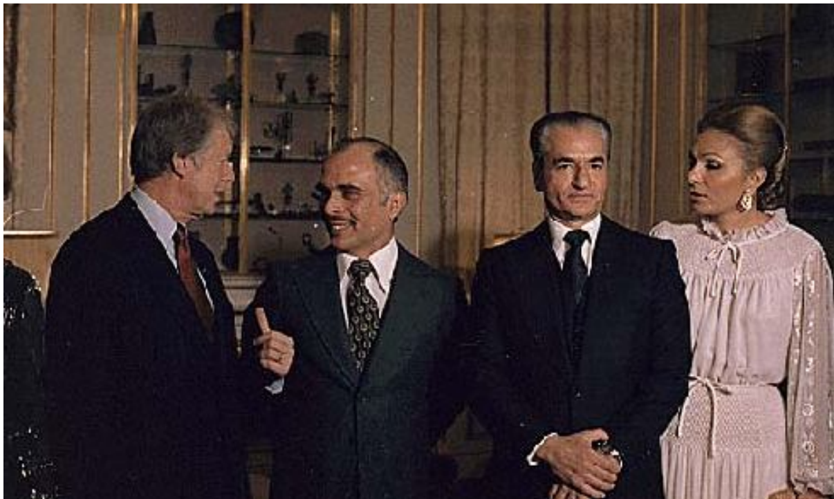
لە چەپەوه، جيمى کارتر سەرکۆمارى ئەمريکا، مەليک حسين شای نۆردەن، حەمەرەزاشا و شاژنى ئيران

روژى 16ى مانگى گەلاويزى 1356ى هەتاوى (7/8/1977)، بە فەرمانى شا، سەرۆکە زىران ئەمير عەباس هۆويدا پاش 13 سال لابرە و، "جەمشيد ناموزگار" لە جيبى دانرا. لە روژى 25ى گەلاويزانى 1356، سەرکۆمارى