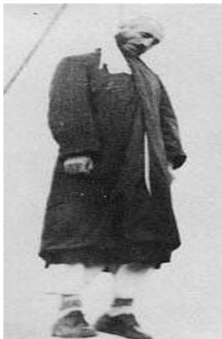
له سیناره دانی پیشه وای کورد له لایه ن حه مه ره زاشاوه

سالیکی دوای کۆتاییهاتی جهنگی جیهانی دووهم، ریکه وتی (۲) ی ریبه ندانی ۱۹۴۶، له شاری مه هاباد، کۆماری سه ره به خۆی کوردستان دامه زرا. به چه ند مانگیکی دوای دامه زرانی کۆمار، به نه خشه ی ئینگلیز، ریکه وتنیککی ساخته له نیوان قه وامولسه لته نه سه رۆکوه زیرانی ئیران و، ستالین دیکتاتۆری به کیتی سۆفیت مۆرکرا. سوپای روسیا له کوردستان چوه ده ره وه و، سوپای ئیرانی به پشتیوانیی ئینگلیز و نه مریکا توانییان کۆماری کوردستان و، نازه ربایجان بپووخین و، سه ره له نوێ ده سه لاتی رژیمی په هله ویی به سه ره ئیران و رۆژه لاتی کوردستاندا دابه سه پیننه وه.